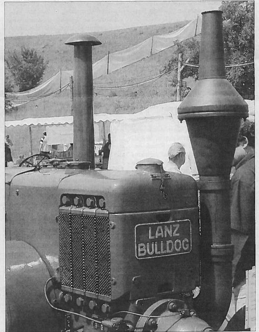
Spricht für sich, Ton und Grösse erweisen dem Namen alle Ehre.